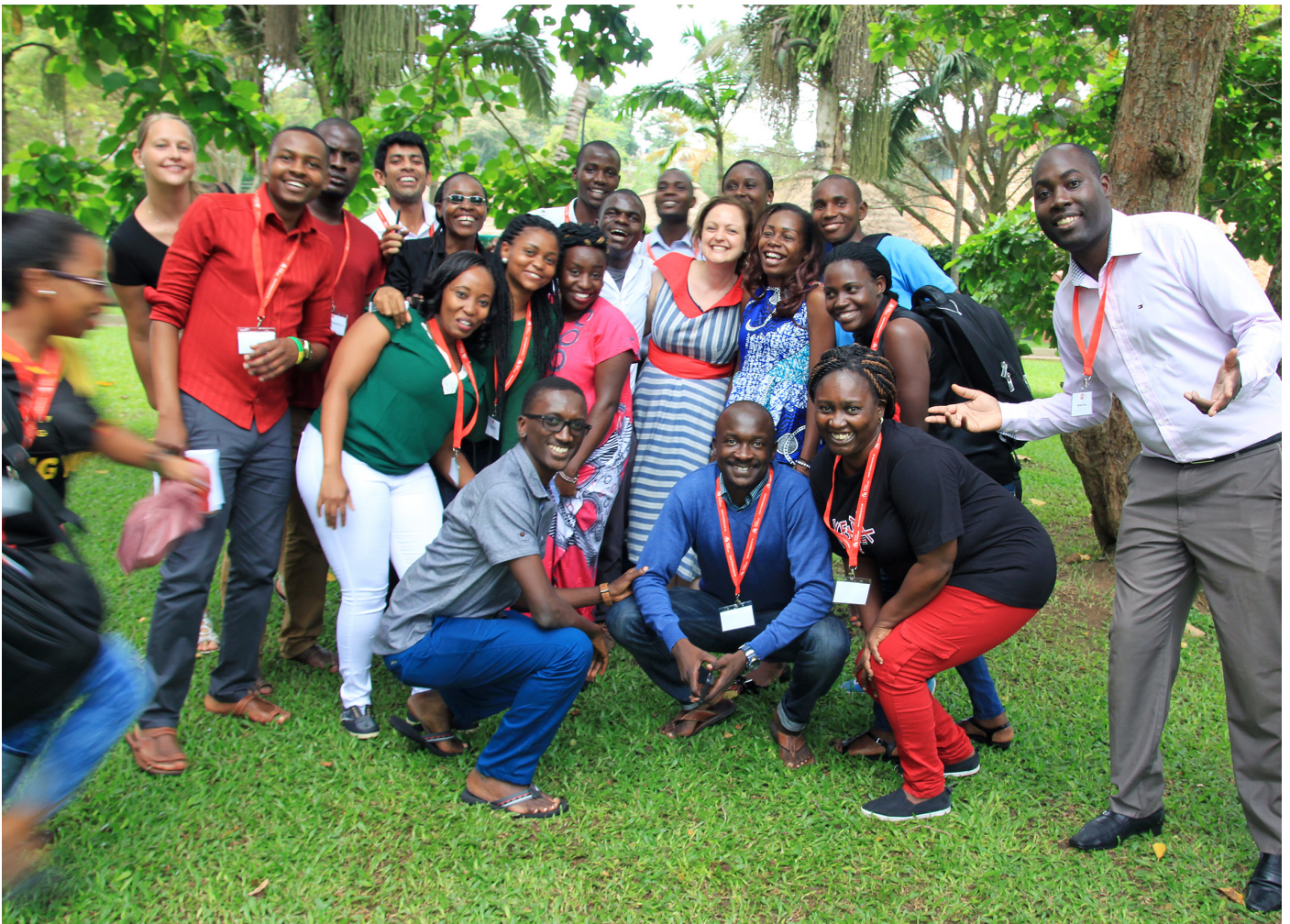
Forberedelseskurs i Kampala, april 2017.

Driftsutgifter utgjorde i 2017 kr 45 884 268. Lønn og sosiale utgifter utgjorde 64,3 % av driftsutgiftene i 2017.