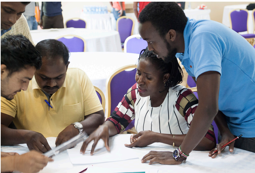
Forberedelseskurs i Kampala, april 2017.