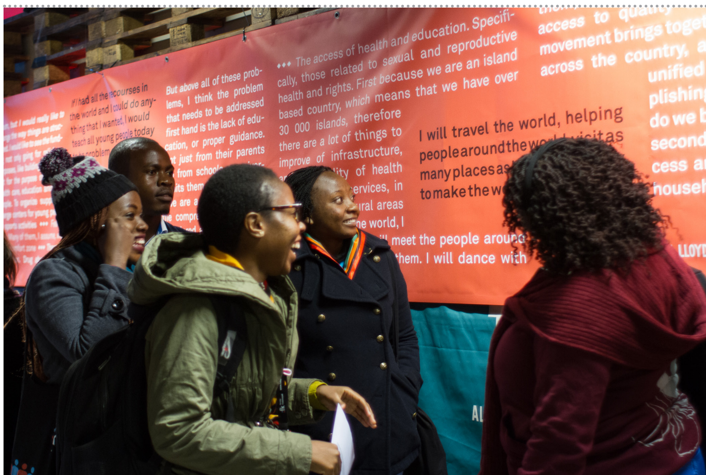
Deltakere på Ungt lederskapskonferanse 2017

Utenriksdepartementet ga fredskorpset en rekke føringer i tildelingsbrevet for 2017. Resultatmål er rapportert på sidene 6-8. Særskilte føringer og fellesføringer er rapportert på i tabell 4.